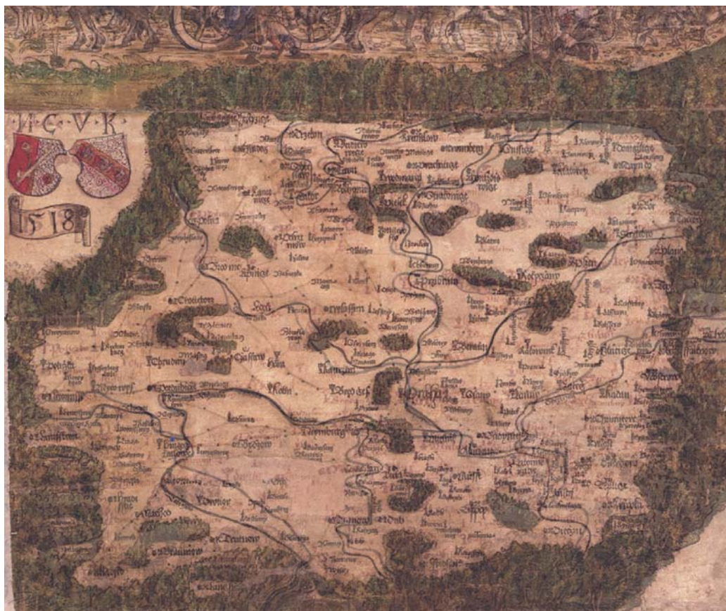
Obr. 4 Srovnání faksimile Klaudyánova tisku (intenzivní barvy) a Rychnovské rukopisné kopie georeferencováním v programu ArcGIS (archiv autorky)

V případě Rychnovské kopie se jedná o rukopisnou kopii. K této skutečnosti je potřeba přihlížet a drobné odchylky ponechat stranou. Při porovnání originálního Klaudyánova tisku a rukopisné kopie georeferencováním v programu ArcGIS (obr. 5) byla zjištěna střední kvadratická chyba 111,294 m, která vypovídá o přesnosti a důslednosti kopisty. Již rozdíly v rozměrech předlohy a kopie vyloučily vznik mapy metodou propichování, zatímco vodící linie a pomocné čáry vypovídají o zcela jiné metodě vzniku. Ze způsobu, jakým jsou jednotlivé prvky na mapě rozmístěny, je zřejmé, že kopista nejdříve překreslil hraniční lesy, k čemuž mu pomohl již zmíněný rámec, který byl později vytažen inkoustem. Tento rámec při procesu vzniku kopie pomáhal k lepšímu rozvržení prostoru. Dále byly překresleny vodní toky a až následně zanesen vnitřní lesní porost. Teprve v okamžiku, kdy byl kopista spokojen se