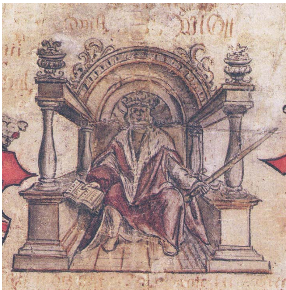
Obr. 2 Znáznornění vladaře na faksimile Rychnovské kopie