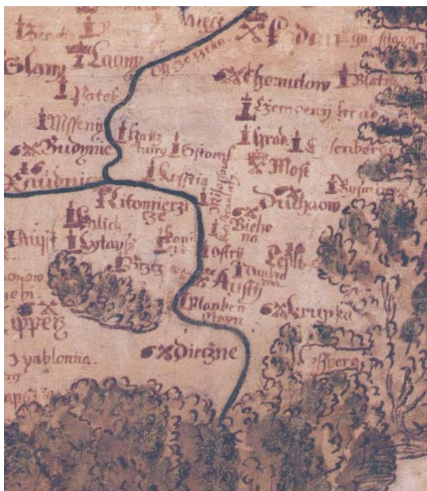
Obr. 6 Překreslení toponym a jejich značení na faksimile Rychnovské rukopisné kopie

směrem tahů, zvýraznil je silnými liniemi. O tomto postupu svědčí pomocné tahy, které se dochovaly na několika místech. Pravděpodobně nejzřetelnější nalézáme v zákrutu Vltavy mezi Milevskem a Zvíkovem. Kopista se následně pokoušel zachytit rozložení sídlišť a překreslení značení, ke kterým až následně dopsal text s využitím zbyvajících prostoru. Některá místní jména jsou pečlivě přepsána