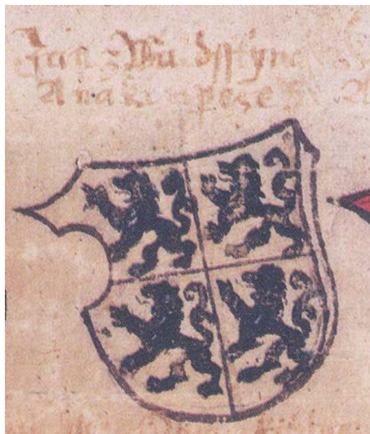
Obr. 3 Erb Jana z Valdštejna bez tinktur a kovu v poli, faksimile Rychnovské kopie

intenzivních sytých barev a v některých případech lze i na faksimile pod začerněním pozorovat prosvítající modrou barvu.