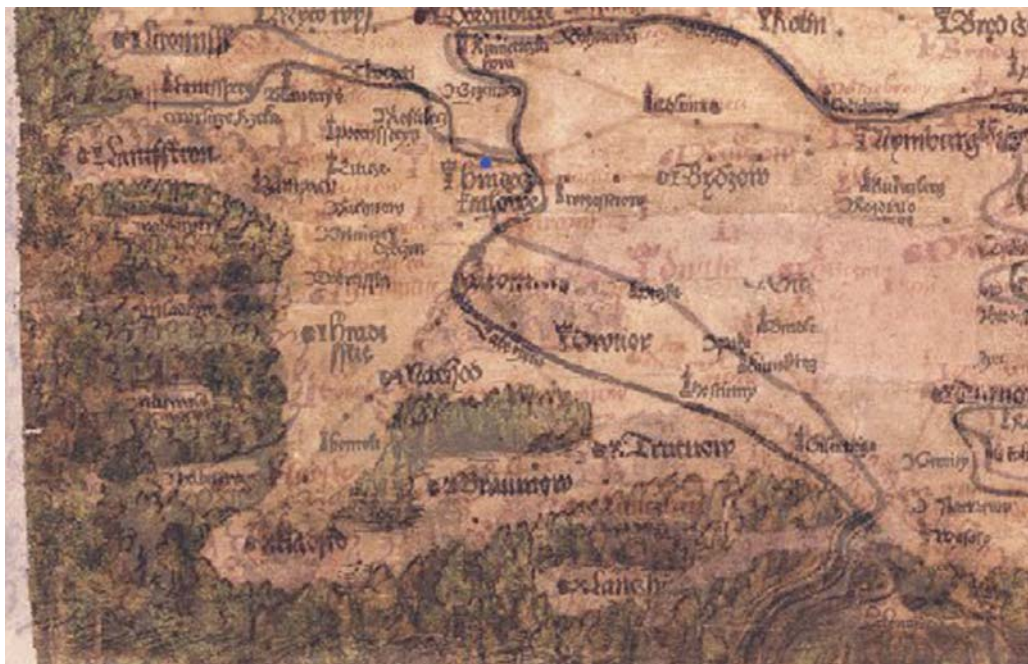
Obr. 5 Georeferencování v programu ArcGIS detail toku Labe (Klaudyánova mapa intenzivních barev a Rychnovská rukopisná kopie s méně zřetelným duběnkovým inkoustem) (archiv autorky)